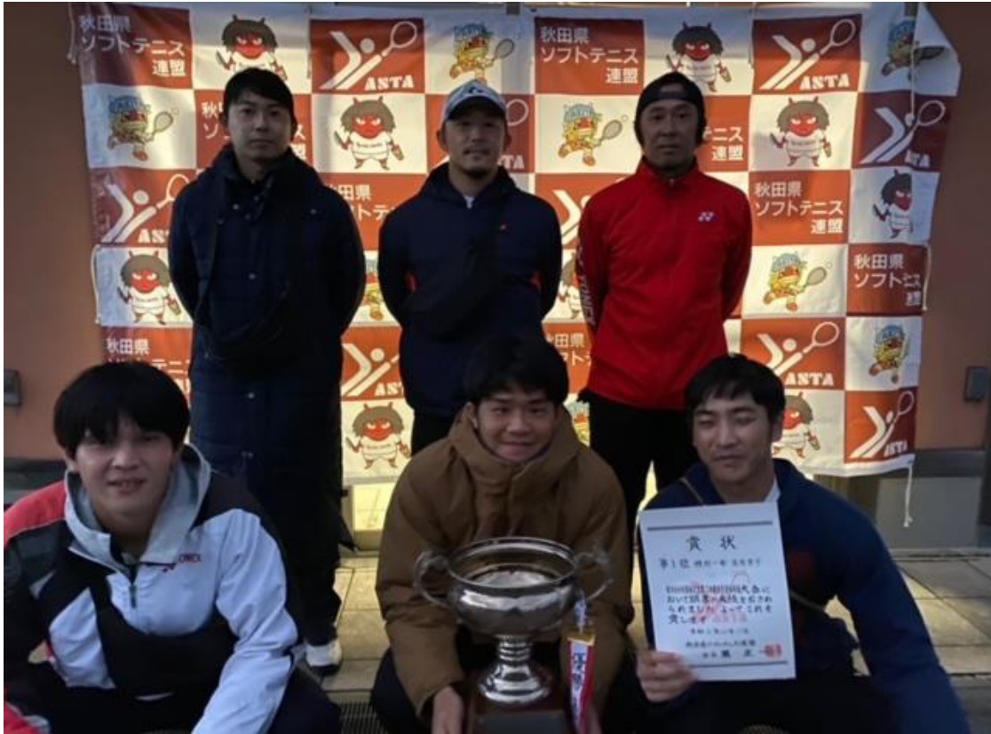
能代市協会(能代市)