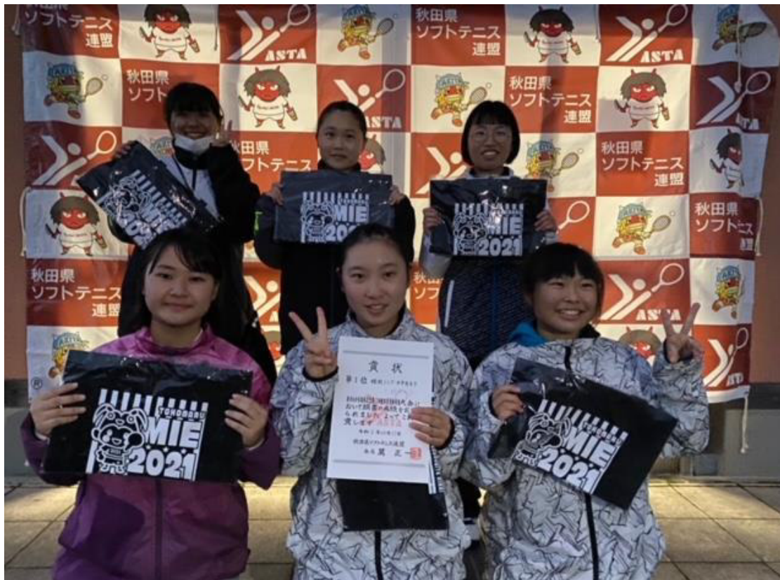
大館東中学校(中体連)